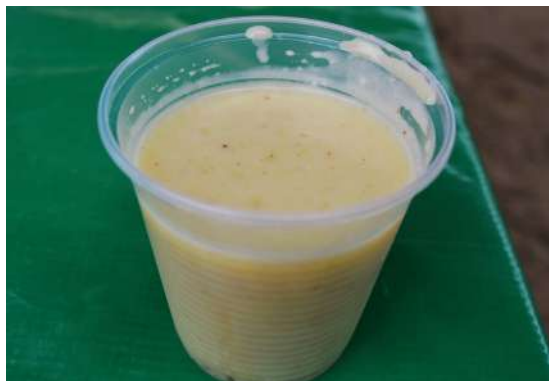
Umbuzada de leite de licuri