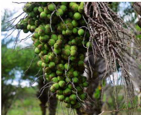
Cachos de Licuri

Versátil, o licuri está presente na culinária e no cotidiano das famílias. Seu leite é utilizado no preparo de peixes, arroz, bolos e umbuzada. O coquinho pode ser consumido cozido ou seco — este último, inclusive, é comercializado para a produção de rosários. Até seus subprodutos são aproveitados: a torta resultante da extração do óleo é utilizada na alimentação animal, contribuindo para o desempenho produtivo, especialmente de caprinos.