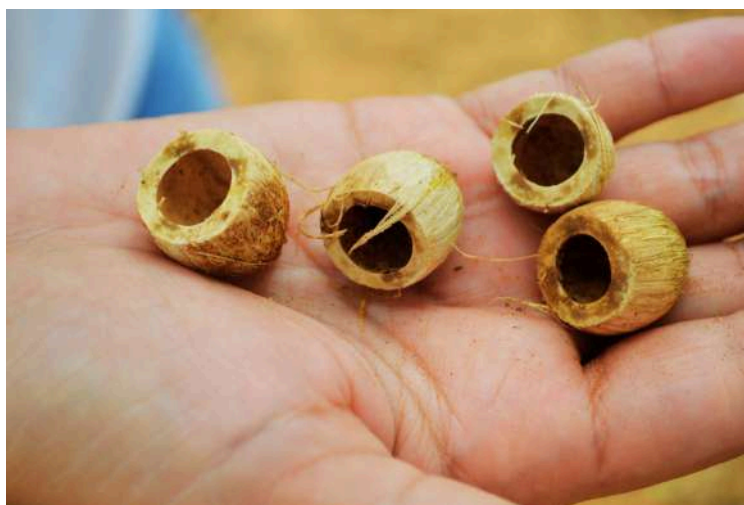
Casca de Licuri abertas pelas araras-azuis-de-lear

Conhecido como licuri, ouricuri ou coquinho, esse fruto da Caatinga sempre foi sustento em tempos difíceis. Em períodos de seca, muitas famílias sobreviveram do “bró”, farinha feita da massa do licuri seco. No entanto, sua importância vai além da alimentação humana: no ambiente natural, o licuri sustenta a vida de diversos animais, como a arara-azul-de-lear, ararinhas-azuis, preás, mocós, caititus e tatus, além de servir como complemento na alimentação de rebanhos.