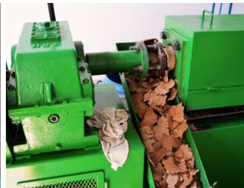
Ração animal feita de Licuri

É nesse cenário de múltiplos usos e significados que o licuri se firma como um elemento de resistência e convivência com o Semiárido — e, sobretudo, como uma tradição mantida pelas mãos das mulheres.