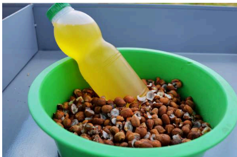
Óleo de Licuri e coquinhos secos