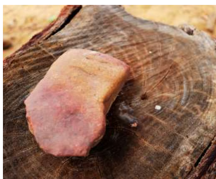
Pedra para quebrar Licuri

Tradição e Infância: Para muitas pessoas da região, o rosário de licuri marcou a infância, servindo tanto como distração, na brincadeira de rodar o rosário, quanto como alimento, sendo consumido “coquinho por coquinho”.