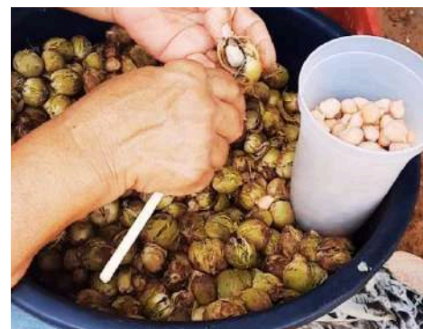
Neuza retira coquinhos da casca