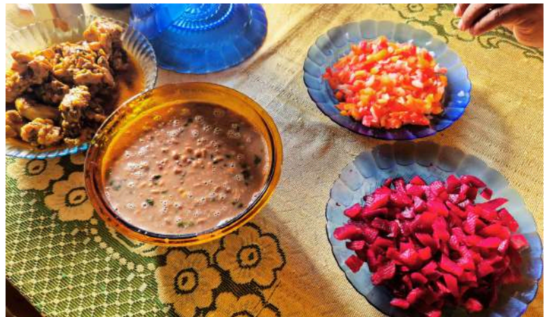
Refeição produzidos com produtos da horta