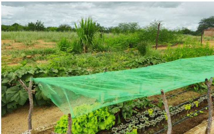
Canteiros e sementeira