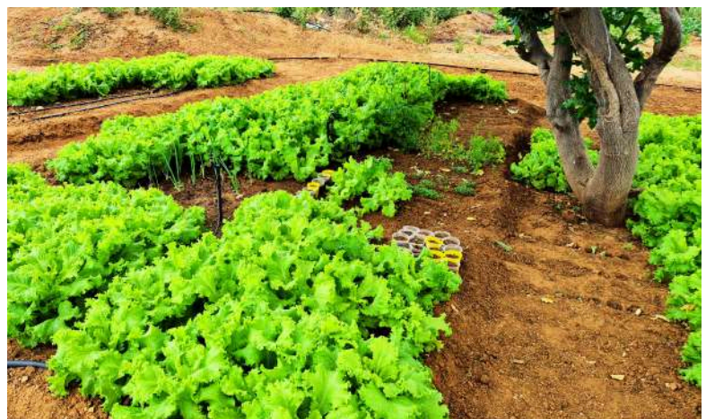
Canteiros de alface