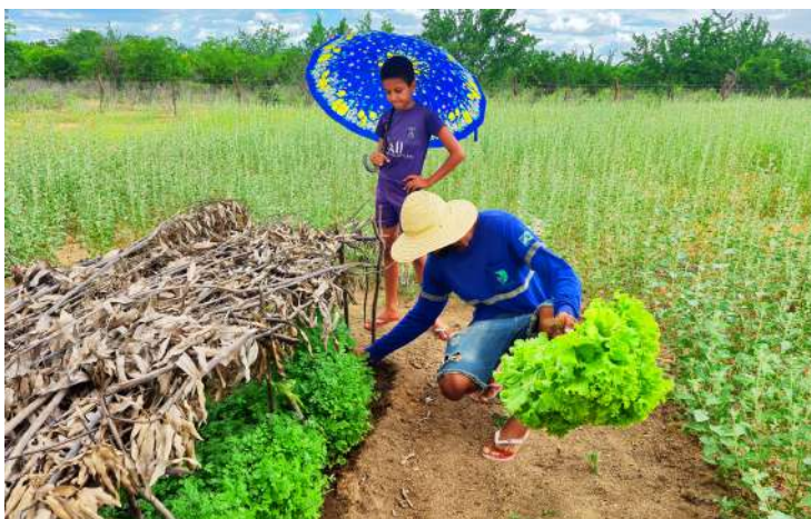
Canteiros de coentro