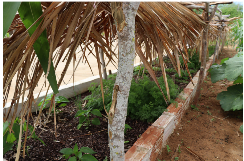
Canteiros de coentro