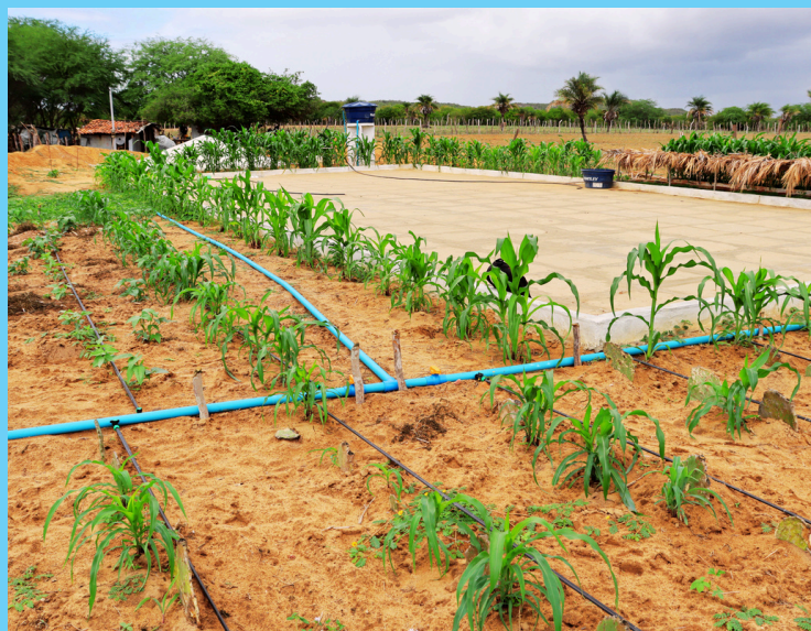
Gilvânia cortando palmas, cisterna integrado a cultivo de feijão e milho