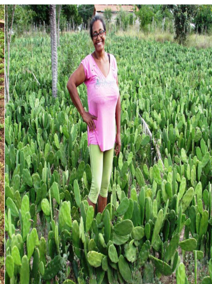
Cultivo de palma