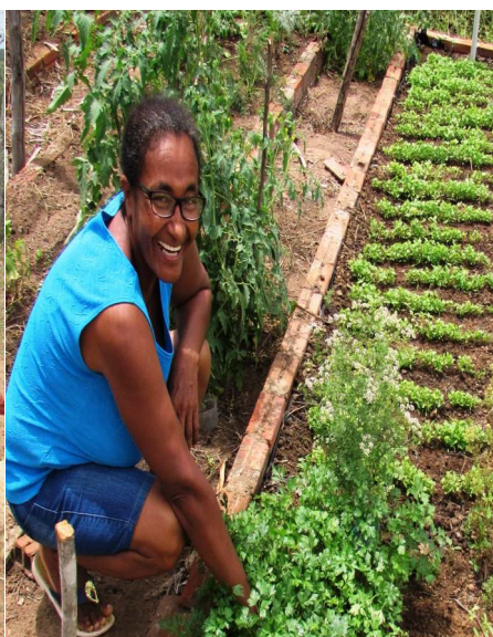
Cultivo de horta